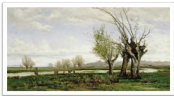
"Orillas del Manzanares", óleo de Aureliano de Beruete

El primero de ellos, "Orillas del Manzanares", se inspiró en el cuadro homónimo del pintor Aureliano de Beruete (Madrid, 1845-1912), uno de los paisajistas más destacados de la pintura española. La música evoca los colores y el curso breve y divagante del río madrileño. El óleo, en el que Madrid puede verse al fondo con algunos de sus edificios más emblemáticos, entre ellos San Francisco el Grande, data de 1878 y se conserva en el Museo del Prado.